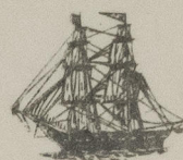
1820 BRIGNO PLINIO

CODICI USATI: A.B.C. 5 a EDIZ. WATKINS - 19 th EDIZ. 1902 E EDIZ. DEL 1904 SCOTT'S 9 th EDIZ. 1896 E 10 th EDIZ. 1899 BENTLEY'S 80E